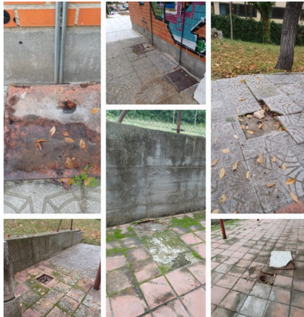
San Sebastián de los Reyes, a 2 de enero de 2025

Ante esta situación, solicitamos al gobierno municipal y a la concejalía responsable nos informe sobre si se van a realizar las obras y mejoras que el el centro de Atención Temprana de San Sebastián de los Reyes necesita y así garantizar la seguridad y el bienestar de las y los menores usuarios y los profesionales que trabajan en este centro.