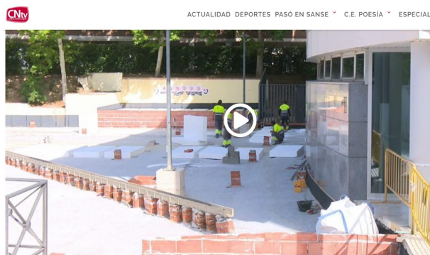
Una plaza bonita y moderna se estrena en septiembre junto a la biblioteca Marcos Ana

De igual manera, solicitamos que se tomen las medidas necesarias para agilizar los trabajos y se informe a la ciudadanía correctamente del plazo para su finalización.